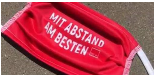
ver.di-Mund-Nasen-Schutz: „Mit Abstand am besten“ für unsere aller Gesundheit.

* https://www.bghw.de/die-bghw/faq/faqs-rund-um-corona/allgemeine-schutzmassnahmen/mund-und-nase-bedecken-visiere-oder-atemschutz